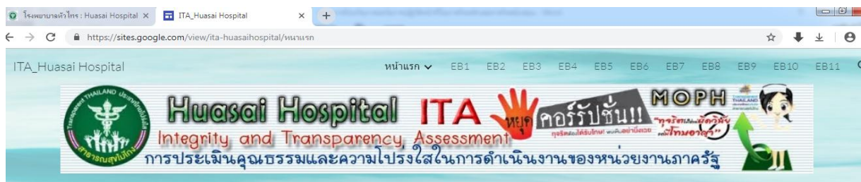
โรงพยาบาลหัวไทร...มุ่งมั่นสู่การเป็นองค์กรที่มีคุณธรรมและความโปร่งใส

ให้เข้มแข็ง และมีประสิทธิภาพผ่านกระบวนการประเมินคุณธรรมและความโปร่งใสในการดำเนินงานของหน่วยงาน (Integrity and Transparency Assessment : ITA) สำนักงาน ก.พ.ร. กำหนดให้การประเมิน ITA เป็นตัวชี้วัดตามคาร์บอน การปฏิบัติราชการของส่วนราชการระดับกรมและระดับจังหวัด (กำหนดเป็นตัวชี้วัดที่ ๘ ระดับคุณธรรมและความ โปร่งใสในการดำเนินงานของหน่วยงาน ในมิติภายใน มิติการพัฒนางานองค์กร น้ำหนักร้อยละ ๕) นอกจากนี้ กระทรวงสาธารณสุขได้กำหนดให้การประเมิน ITA เป็นตัวชี้วัดเน้นหนักตาม ยุทธศาสตร์กระทรวงสาธารณสุข (ตัวชี้วัดที่ ๒๑ ร้อยละของหน่วยงานในสังกัดกระทรวงสาธารณสุขผ่าน เกณฑ์ประเมินระดับคุณธรรมและความ โปร่งใสในการดำเนินงานของหน่วยงาน เฉพาะหลักฐานเชิงประจักษ์ (Evidence Based Integrity and Transparency Assessment : EBIT) เช่นเดียวกัน ทั้งนี้การ ขับเคลื่อนยุทธศาสตร์ชาติว่าด้วยการป้องกันและปราบปรามการทุจริต ระยะที่ ๒ (พ.ศ.๒๕๕๖-๒๕๗๐) ได้ กำหนดเป้าหมายเชิงรูปธรรมในเรื่องการพยายามเพิ่มค่า คะแนน CPI (Corruption Perception Index) ซึ่งอยู่ที่ กลไกของภาครัฐเป็นส่วนใหญ่ และค่า CPI นี้ ยังเป็นหนึ่งในเป้าหมายหลักของแผนพัฒนาเศรษฐกิจและ สังคมแห่งชาติ ฉบับที่ ๑๑ (พ.ศ. ๒๕๕๕-๒๕๕๙) ในการสร้าง ภูมิคุ้มกันของสังคมไทย คือ การบริหาร จัดการที่โปร่งใส ตรวจสอบได้ และมีประสิทธิภาพ